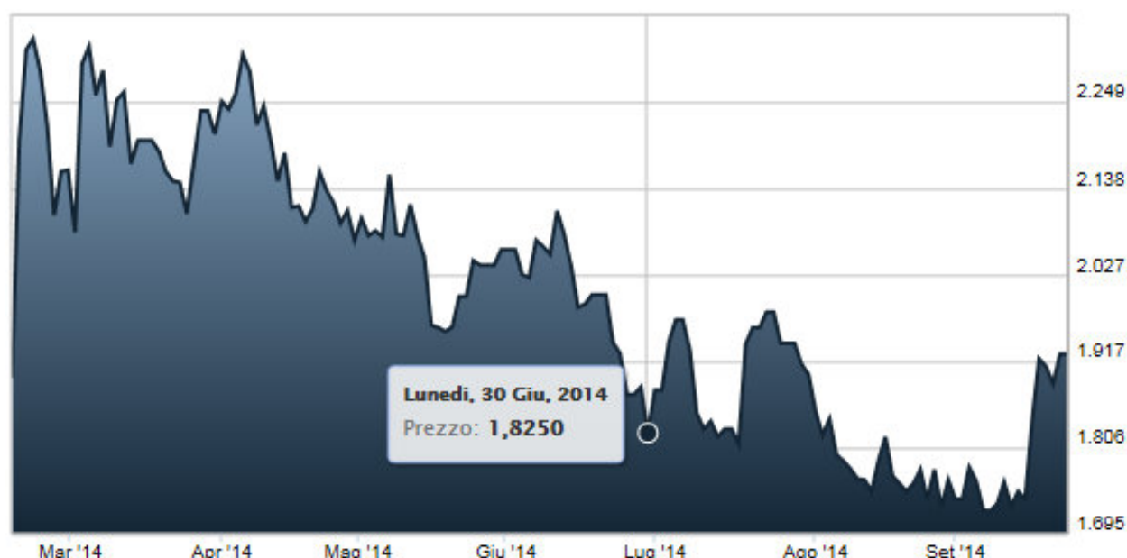
Grafico del titolo dall'IPO al 23/09/2014